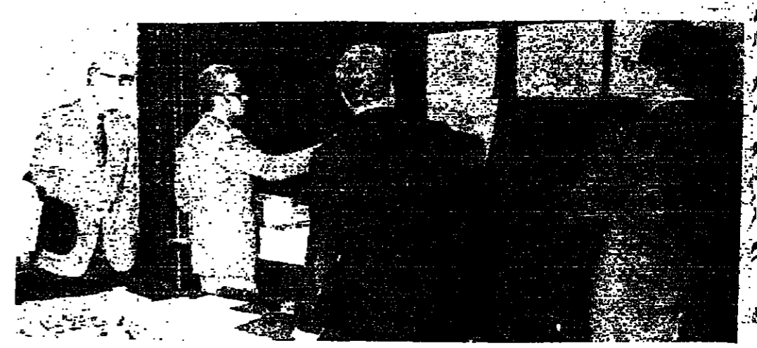
أعضاء البعثة أهم خرائط وسط بيروت

أعطى المسؤولون عن مصلحة الطلاب في الكتائب كما هي منظمة طلاب الأحرار ، بالتنسيق مع القيادات العسكرية في الحزبين ، تعليمات محددة أمس بمنع حمل السلاح داخل الثانويات ، ومنع الشعارات داخل المدارس والكتائب ، ونما للآثار المصاحبة . وقام الشيخ بشير الجويل والسيد داني شمعون بجولة أمس على الثانويات ، وحذرن من انصاف الجبال لعناصر الشغب والعرضي ، للاختصاص بين المنع الحزبية المتحالفة . وفي المساء ترأس السيد ميشال سباحة بعد ظهر أمس اجتماعاً استثنائياً لمصلحة طلاب الكتائب ، ضم رؤساء الدوائر والمخلاء الجامعية والثانوية ورؤساء أقطاعات ومفوضي الطلاب في الأقاليم والمناطق . ودرس الاجتماع على مدى ساعة ونصف الساعة الوضع العام ، في ضوء المعلومات الواردة عن قيام حركة مشبوهة في الثانويات والكتائب معها تنكفك الجبهة اللبنانية في الوسط الطلابي من خلال خلق علاقة صديقية بين أحزاب الجبهة . البقية على الصفحة ٧ -